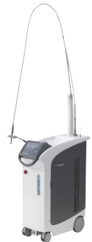
Er:YAGレーザー装置 「アーウィン アドベール」

当院ではこの度、むし歯治療での使用を唯一薬事認可された、歯科用Er:YAGレーザー装置「アーウィン アドベール」を導入しました!