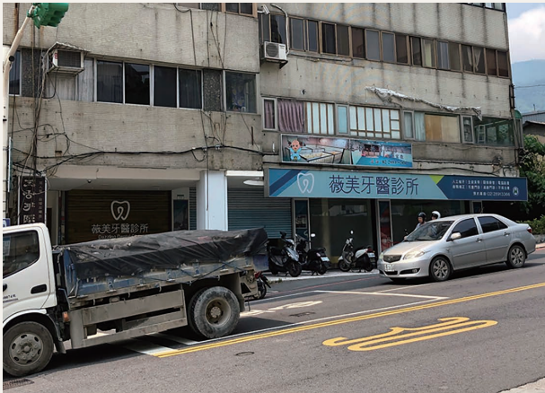
台湾の歯医者(テナントですね～!)

台湾前半は温泉街に宿泊。暑かった・・・とにかく食べる食べるの毎日。 歯科医院がたくさんありました。台湾の歯科事情は日進月歩で、日本から たくさんの優秀な歯科医師を招いてトレーニングを受けているとのこと。